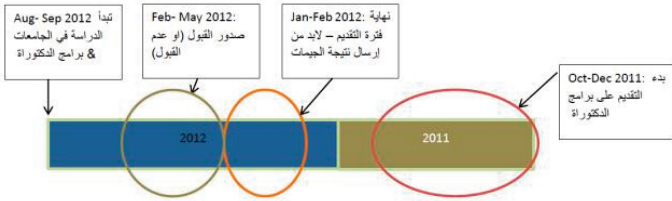
شكل ١ مثال توضيحي لفترة التقديم

يمكن التقديم لقبول الدكتوراة قبل الانتهاء من الماجستير بحوالي سنة على الأقل