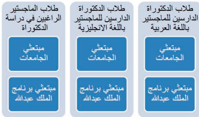
شكل ٢ تقسيم الطلاب المتقدمين لقبول دكتوراة في الادارة

يمكن تقسيم الطلاب السعوديين المقدمين على دراسة الدكتوراة التخصصات الإدارية في الجامعات الامريكية إلى ثلاث مجموعات (شكل ٢):